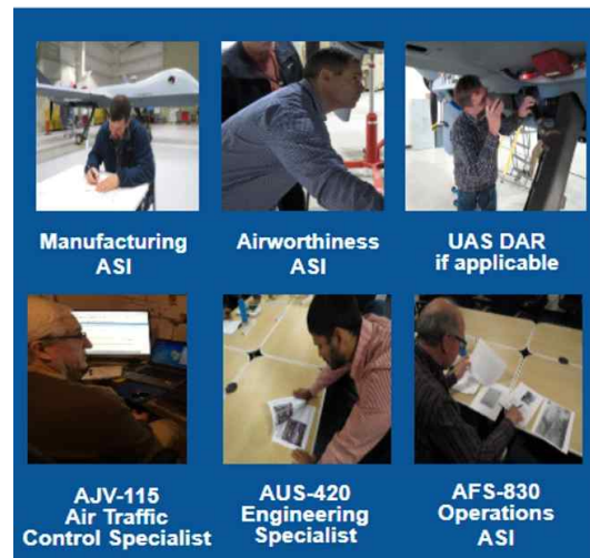
Fig. 3. FAA certification team (AIR-900, 2018)