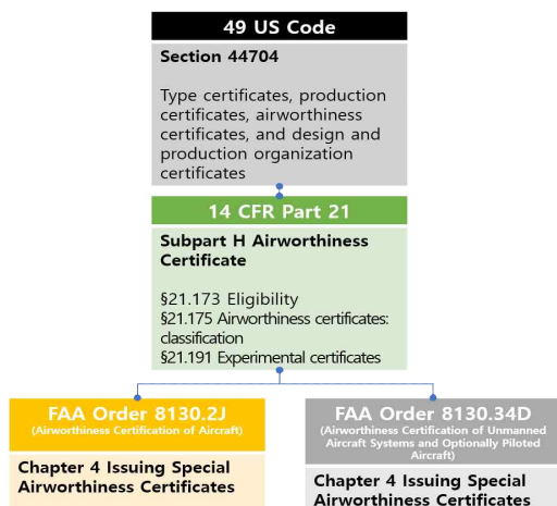
Fig. 1. Regulations of airworthiness certification for UAS

무인항공기의 감항증명과 관련된 미국 법령은 49 U.S. Code §44704와 FAR §21.175이며, 실험분류 특별감항증명은 FAR §21.191 조항을 따른다(Fig. 1). 실험분류에는 연구개발(R&D), 훈련(crew training), 시장조사(market survey) 등을 포함한다. 상세지침은 유인항공기의 감항증명 절차인 FAA Order 8130.2 “Airworthiness Certification of Aircraft”와 별도로