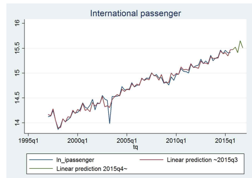
Fig. 1. Passenger demand forecast graph

Fig. 1을 살펴보면, 전반적으로 1997년 IMF 외환위기, 2008년 세계금융위기에 일시적이지만 대폭 감소하였고, 특히 2002년부터 일정 기간 지속된 질병 요인인 SARS의 영향으로 또 한번 큰 폭으로 감소하였음을 확인할 수 있다.